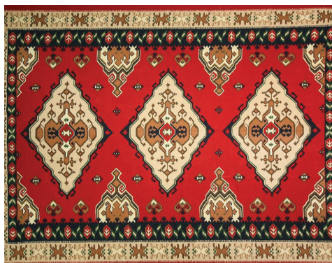
Fig.15 Autorësia Punime Artizanale Ora

Përveç punimeve në vek (sexhade dhe qilima), njihet dhe për punimet e dorës (punime me shtiza, qëndisje dhe punët e grepit), punime në gur (shtëpit e tipit Kullë), gdhendjet në dru etj. Puna me dorë me anë të shtizave, para viteve 50 ka qenë baza për veshjen e përditshme.