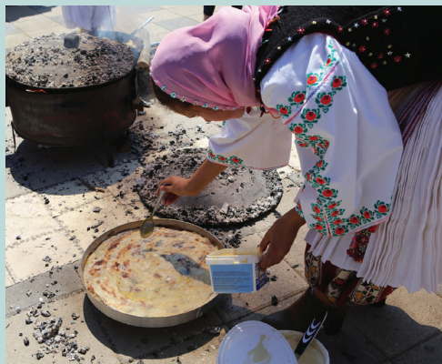
Fig.16 Autorësia Gëzim Cengu

Kuzhina tradicionale: Në këto krahina gastronomia paraqet një interes të veçantë për turistët, vizitorët, eskursionistët dhe kalimtarët e rastit që frekuentojnë këtë zonë dhe që herës tjetër do të jenë vizitor për ta njohur atë. Banoret e Kukësit krenohen me prodhimet unike që ju ofrojnë mysafireve, siç janë: peshku i liqenit të Fierzes, Luciper, rakia e shtëpisë që prodhohet nga rrushi ose kumbulla, mjalti i gështenjes, flija (një byrek i pjekur në zjarr që bëhet me anën e nje saçi prej bakri), gatimet me patate, çorba e Gorës, gubjaniku, boza e famshme, djathi i bardhë i deleve (Çajës), kosi i famshëm i Kroit të Kuq, mishi i tharë, i pjekur, petë misri, pite (byrek), etj.