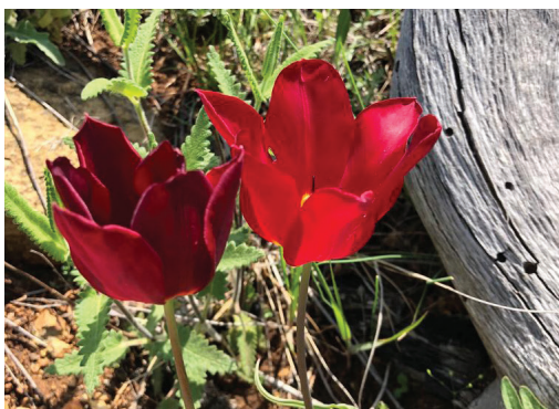
Fig.19 Autorësia Besart Halilaj