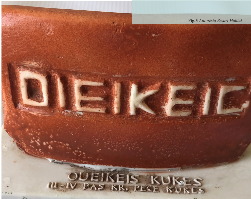
Fig.3 Autorësia Besart Halilaj

Më e spikatur është lufta e popullit të Lumës ndaj serbeve e zhvilluar në qafë të Kolosianit.