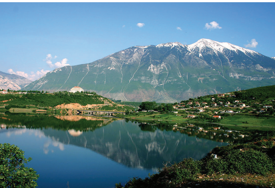
Fig.1 Autorësia Besart Halilaj