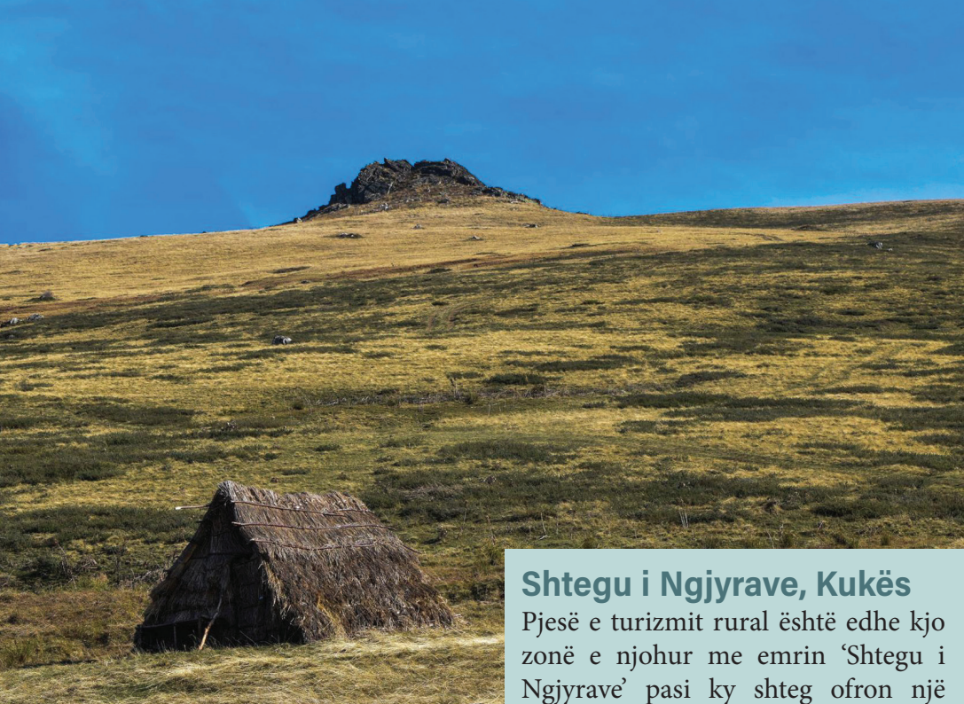
Fig.22 Autorësia Klodian Braha