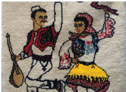
Fig.18 Autorësia Besart Halilaj

Në pavionin arkeologjik ju do të njiheni mbi ekzistencën e qytetërimit kuksian, e cila daton që para 6000 viteve, para lindjes së Krishtit. Në zonën e Kolshit janë gjetur gjurmë që e dëshmojnë këtë fakt. Shfaqja e tumave ilire (kodërvarreve), në periudhën e bronzit, dëshmon gjithashtu për ekzistencën e Kukësit në antikitet.