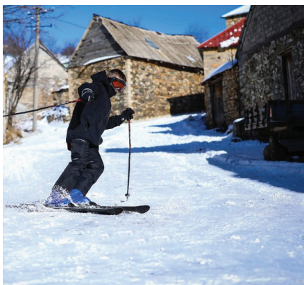
Fig.7 Autorësia Gëzim Cengu