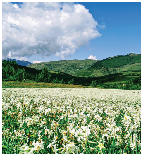
Fig.5 Autorësia Ermal Onuzi