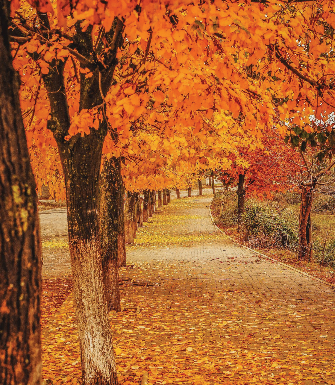
Fig.23 Autorësia Ermal Onuzi

I financuar nga projekti ReLOaD 2 ky material synon promovimin e destinacioneve turistike të bashkisë Kukës me mundësi shfrytëzimi të ekoturizmit, kulturës, kulinarisë etj. Kjo guidë ka një rëndësi strategjike të zhvillimit ekonomik për zonat e bashkisë Kukës të cilat mund të kthehen në destinacione shumë të frekuentuara dhe që zgjerojnë hartën e zonave turistike të vendit.