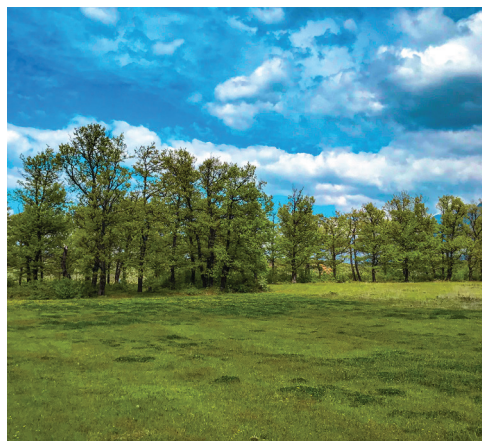
Fig.4 Autorësia Ermal Onuzi

Kjo pasuri natyrore e pranishme në rrethin e Kukësit merr vlera akoma më të mëdha nëse do ta integrojmë me trashëgiminë kulturore të trashëguar brez pas brezi dhe e vendosim në shërbim të turizmit.