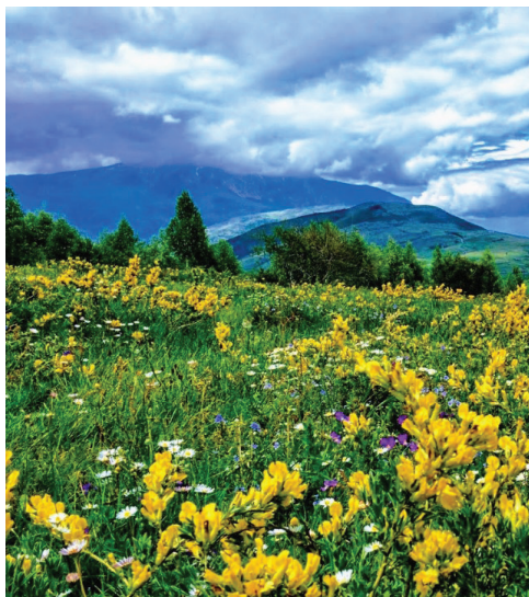
Fig.21 Autorësia Ermal Onuzi

Bullgar të Shqipërisë. Shishtavec, në fakt, konsiderohet një monument natyror pasi ka një numër pikash turistike, relievesh natyrore, bjeshkët e Shishtavecit të cilat ndodhën në një lartësi prej 2130 metrash mbi nivelin e detit, por një pikë vërtetë interesante të cilën në duam t'ju sugjerojmë, është Guri i Mëngjesit. Ky masiv shkëmbor-ranor i gjendur në jug të Shishtavecit është pjesë e monumenteve natyrore shqiptare. Ky gur, i cili kë qenë një pikë referimi që në lashtësi, e ka marrë këtë emër pasi rrezet e para të diellit krijojnë një kurorë drite rreth tij. Ai gjendet në një lartësi 1900 metra mbi nivelin e detit dhe prej kohësh është kthyer në një pikë që vizitohet nga turistët që vizitojnë Bjeshkët e Shishtavecit. Hipizmi është një praktikë e kahershme në këtë zonë, ndaj dhe vazhdon të ushtrohet dhe është mjaft e kërkuar nga vizitorët.