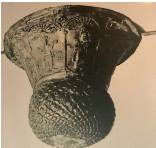
Fig.20 Autorësia Besart Halilaj