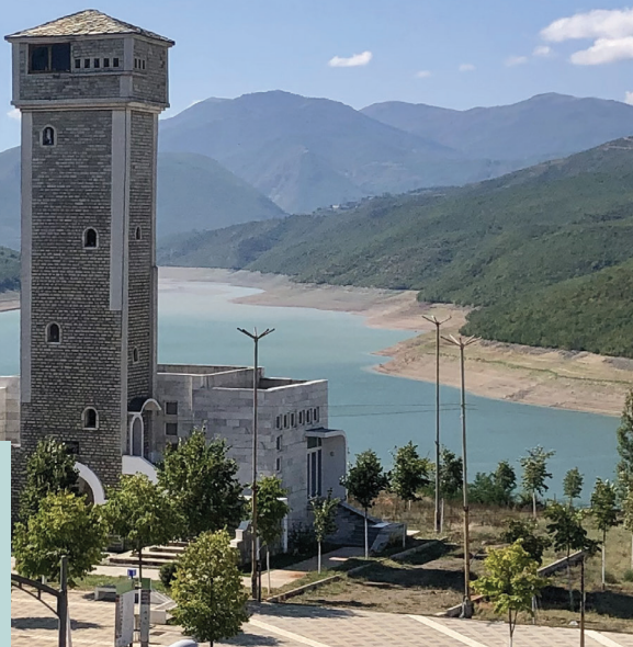
Fig.10 Autorësia Besart Halilaj